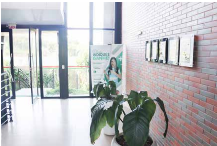
Sociedade Recreativa Mampituba - SC - Entrada do Centro Estético e Esportivo