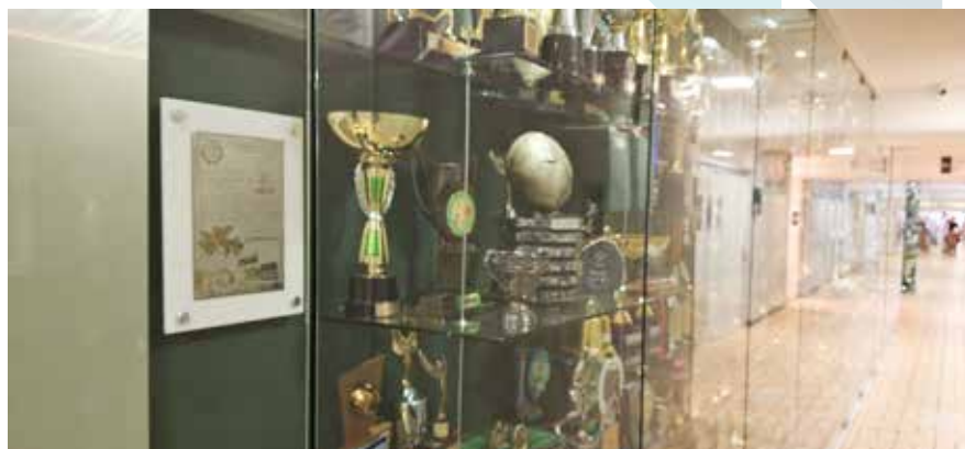
Clube Curitibano - PR - Galeria de Troféus