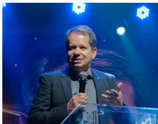
Marco La Porta, presidente do Comitê Olímpico do Brasil - COB