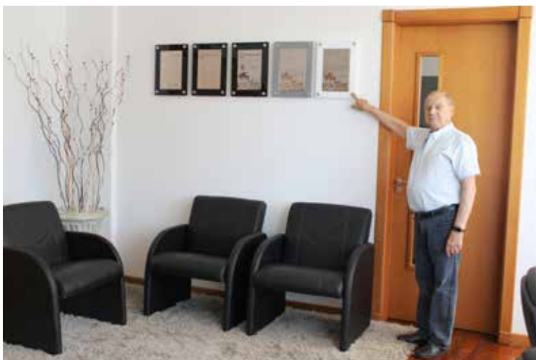
Clube Recreativo Dores - RS - Sala da Presidência