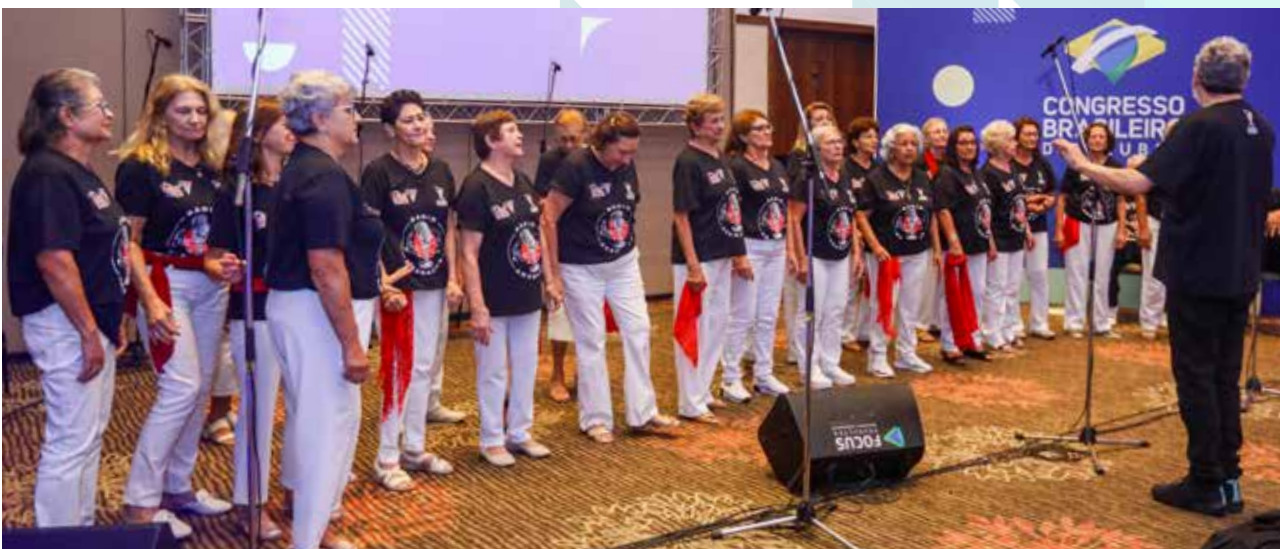
Coral do Clube Atlético Aramaçan/SP