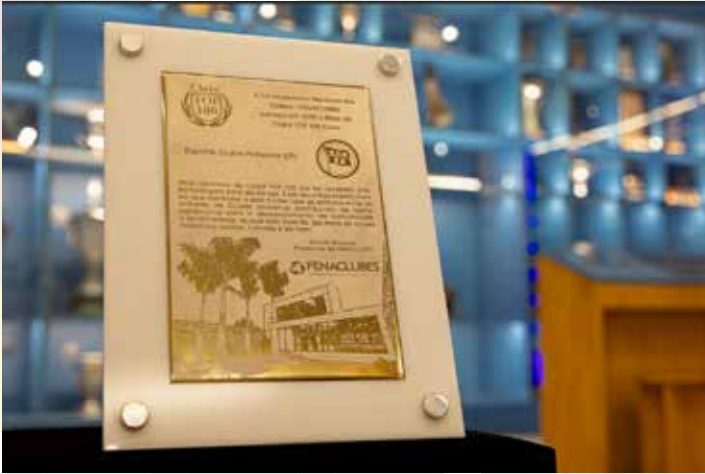
Esporte Clube Pinheiros - SP - Centro Pró-Memória