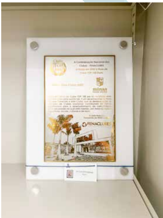
Minas Tênis Clube - MG - Centro de Memória