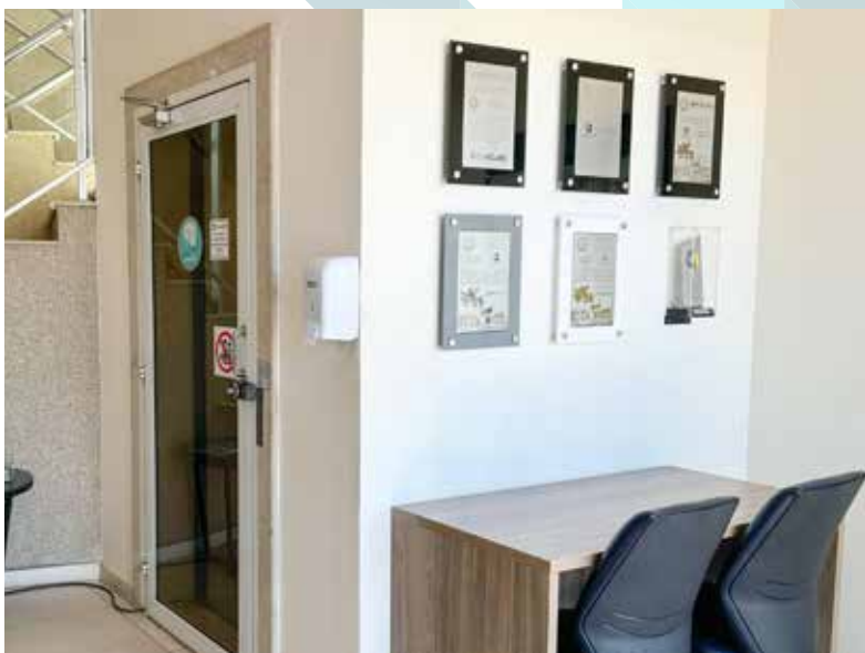
Clube Náutico Araraquara - SP - Hall de Acesso da Secretaria Social