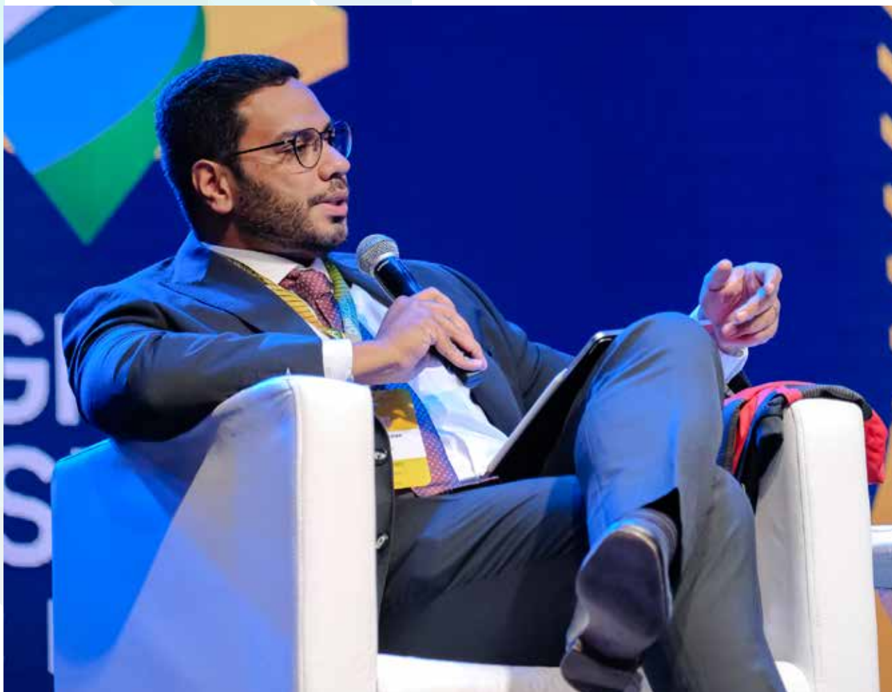
Jhonatan de Jesus, ministro do Tribunal de Contas da União - TCU

“Eu fico muito feliz de estar aqui, conhecendo os presidentes dos principais Clubes do Brasil. Me coloco à disposição de todos vocês e reforço que o TCU já tem seminários que podem ser feitos mostrando cada parte onde o Tribunal age e qual é a melhor maneira dos Clubes usarem este recurso, desde a saída dele da Caixa Econômica Federal, até o mecanismo de prestação de contas continuada do Tribunal”, finalizou.