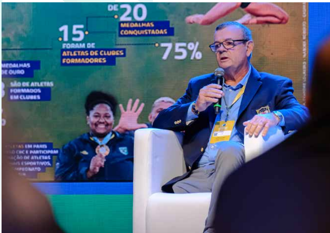
Lars Grael, velejador medalhista olímpico, membro do colegiado de direção e embaixador do CBC

“Eu sou oriundo do Rio Yacht Club, um pequeno Clube de Niterói/RJ que tem apenas 140 associados e poucos recursos para investir. Mas este Clube foi responsável por trazer para o Brasil nada mais, nada menos do que 10 medalhas olímpicas. Isso já dá uma noção da incrível capacidade que todos os Clubes, independentemente de tamanho, têm de formar não só atletas, mas cidadãos no âmbito da saúde preventiva, dos valores, da disciplina e da educação, tendo como consequência a formação de campeões”, relembrou Grael.