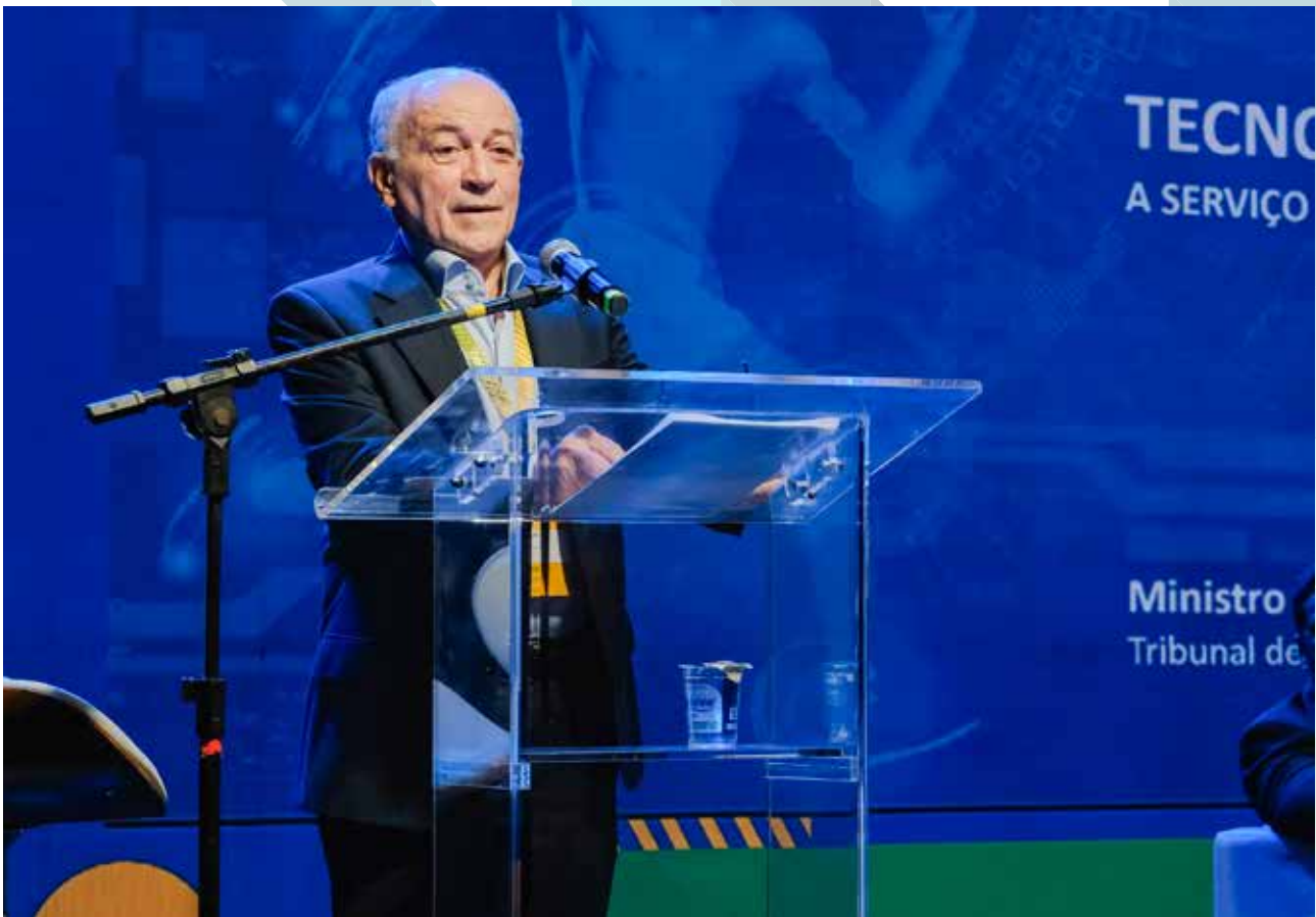
Aroldo Cedraz, ministro do Tribunal de Contas da União - TCU

Por fim, o ministro Aroldo Cedraz usou a palavra para destacar a importância da tecnologia e da inteligência artificial a serviço do esporte e, obviamente, como facilitadores da gestão e da governança em todas as instituições.