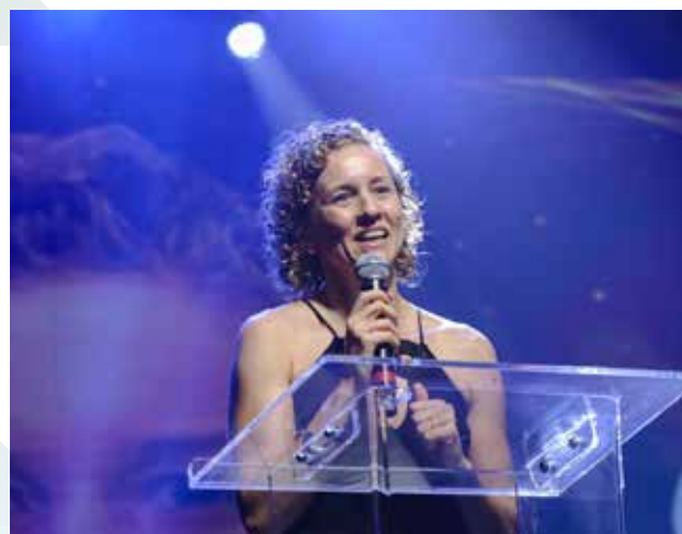
Yane Marques, vice-presidente do Comitê Olímpico do Brasil - COB

Um dos destaques desta edição foi o novo design do troféu, que simboliza o início de um novo ciclo olímpico, marcando um ponto de renovação para o esporte brasileiro.