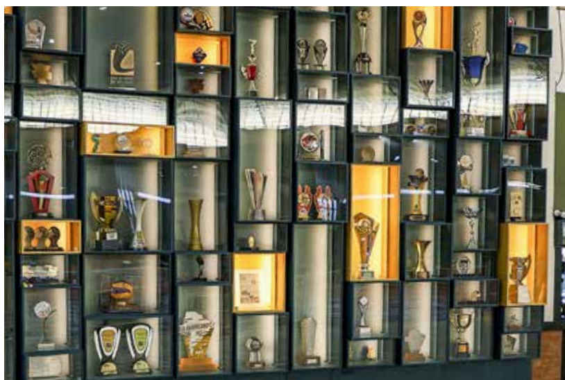
Praia Clube - MG - Galeria de troféus do Clube