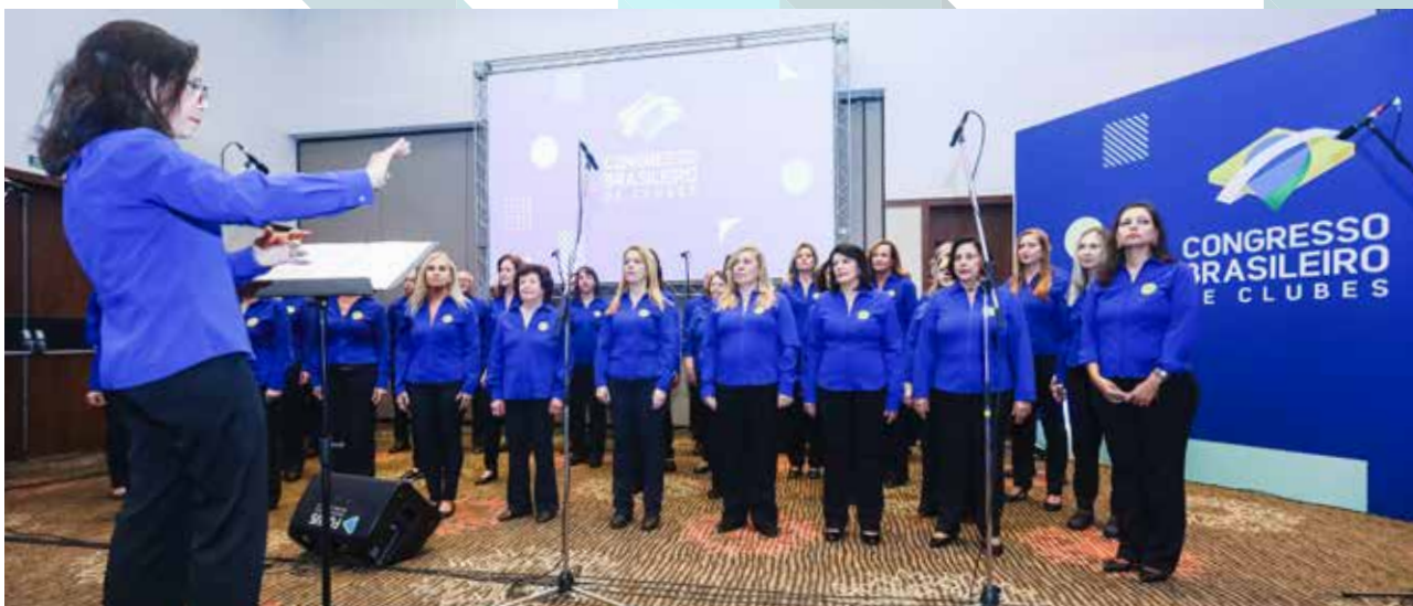
Coral do Círculo Militar de Campinas/SP