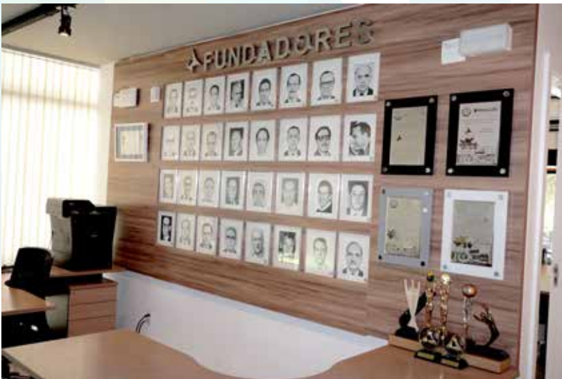
Iate Clube de Brasília - DF - Gabinete do Comodoro