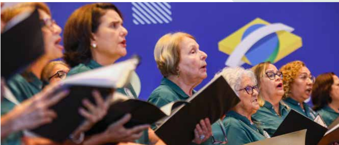
Coral da Sociedade Esportiva Palmeiras/SP