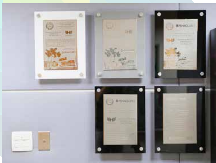
Associação Brasileira A Hebraica de São Paulo - SP - Sala da Presidência

No Congresso de 2026 mais 5 Clubes receberão a Placa Ouro! Confira, a seguir, a Placa Ouro exposta em alguns dos 35 Clubes já homenageados: