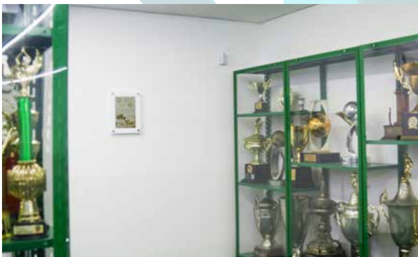
Sociedade Esportiva Palmeiras - SP - Gallerie dei Trionfi na Sala de Troféus