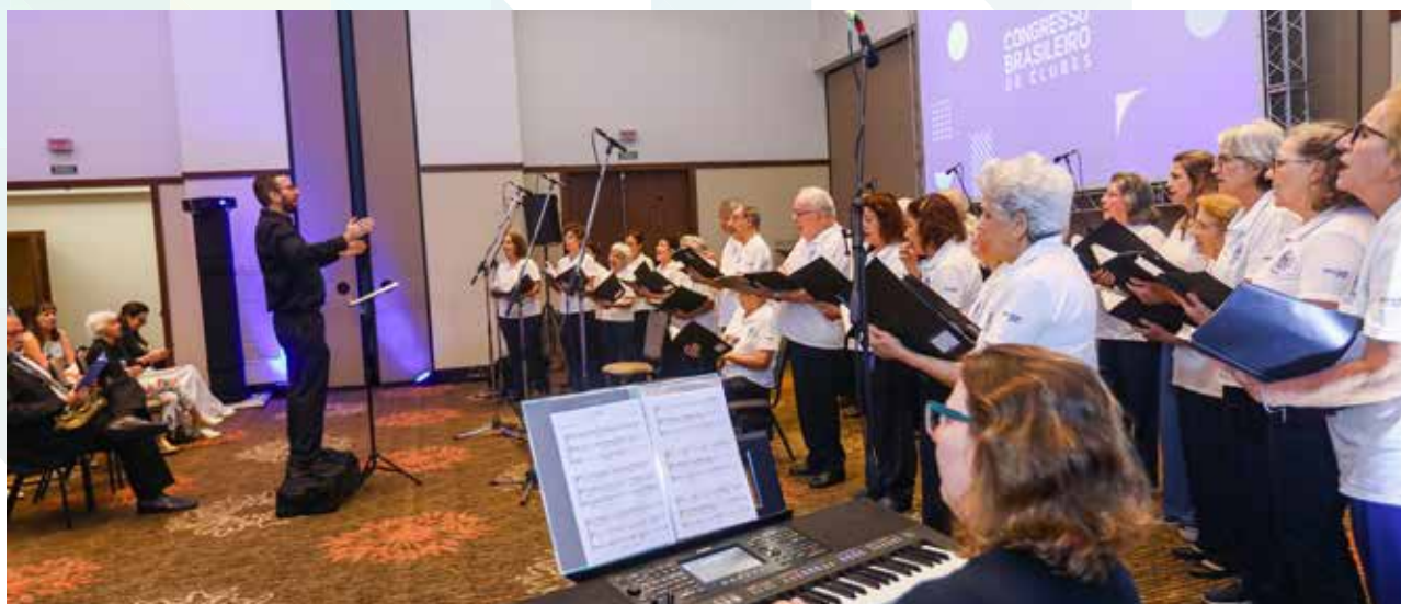
Coral da Associação Atlética Banco do Brasil/SP