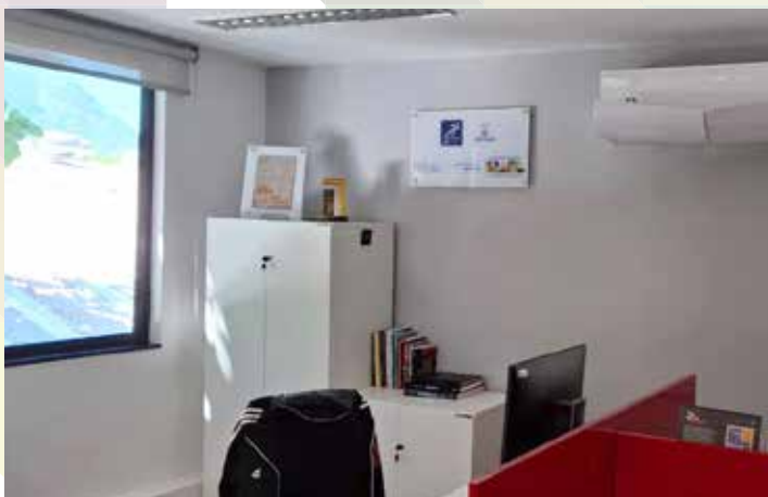
Clube de Regatas do Flamengo - RJ - Sala de Esportes Olímpicos