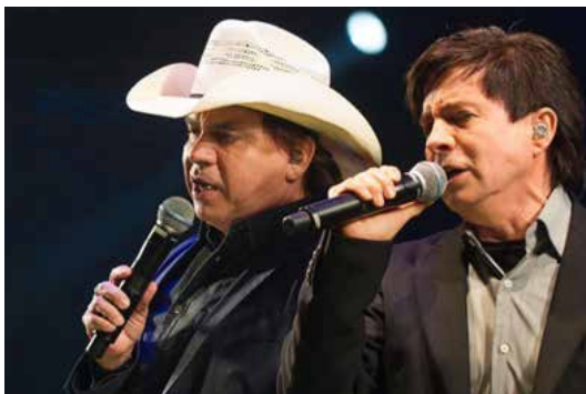
Atração Cultural – Chitãozinho & Xororó